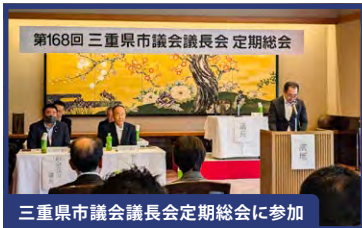
第168回 三重県市議会議長会 定期総会に参加