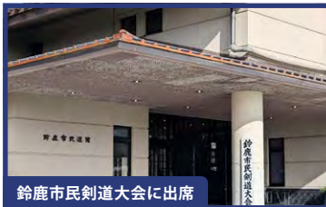
鈴鹿市民剣道大会に出席