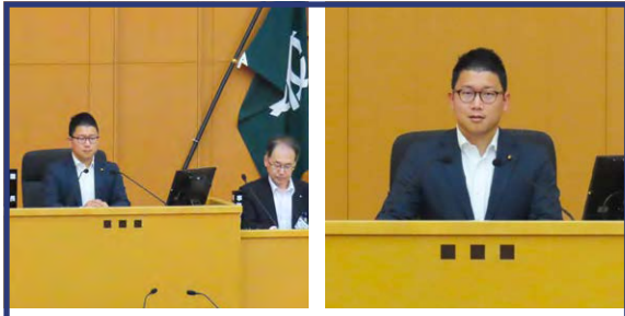
議長に代わり本会議の議事進行をさせていただきました