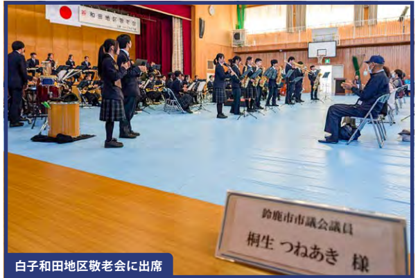
白子和田地区敬老会に出席