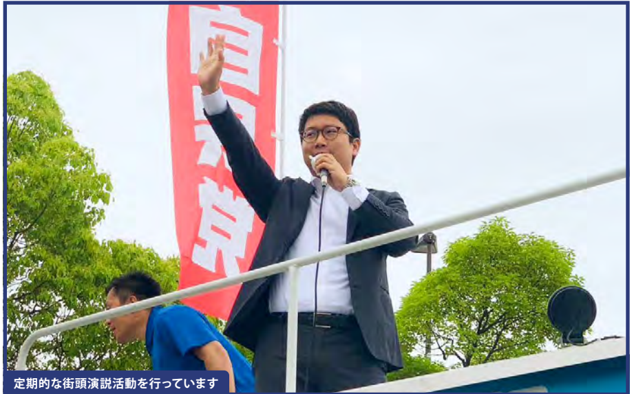
定期的な街頭演説活動を行っています