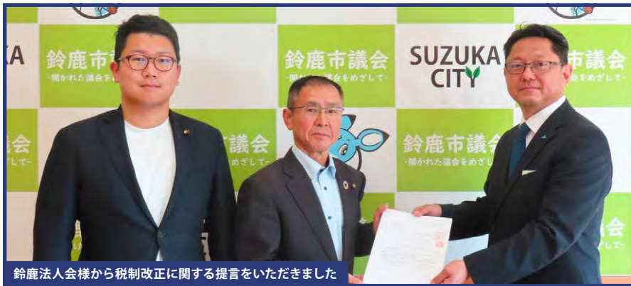
鈴鹿法人会様から税制改正に関する提言をいただきました