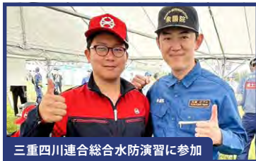
三重四川連合総合水防演習に参加