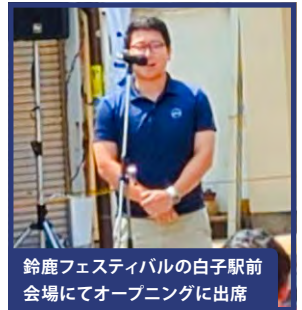
鈴鹿フェスティバルの白子駅前会場にてオープニングに出席