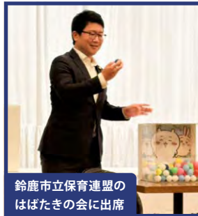
鈴鹿市立保育連盟のはばたきの会に出席