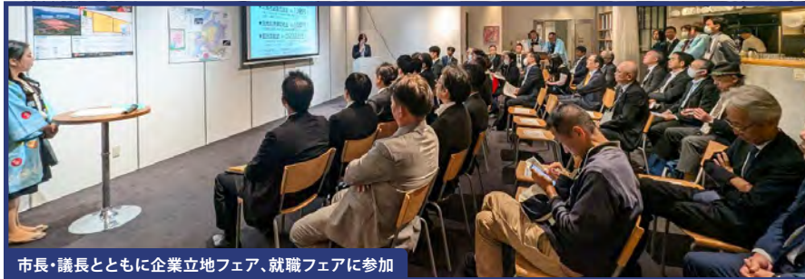
市長・議長とともに企業立地フェア、就職フェアに参加